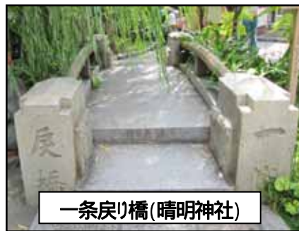
一条戻り橋(晴明神社)