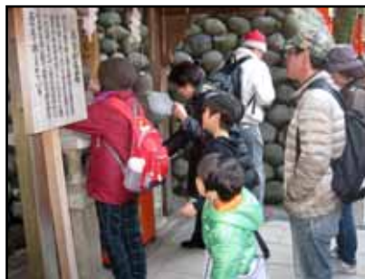
おもかる石に挑戦

の方の地球温暖化などについて説明を聞いた後、6つの班に分かれて館内の見学をしました。水やごみ問題などの展示をみなさん熱心に見学していました。