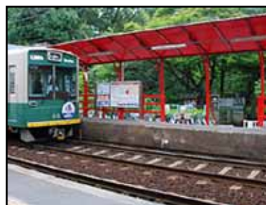
車折神社駅(読めるかな?)