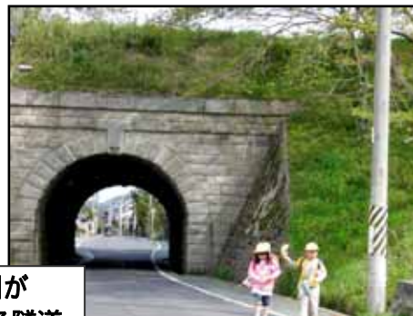
由良谷川が上部を流れる隧道