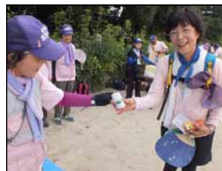
ゴールで提供商品をゲット(16日)