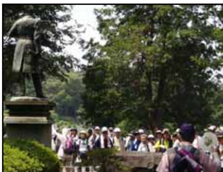
田辺博士像前で疏水物語(15日)