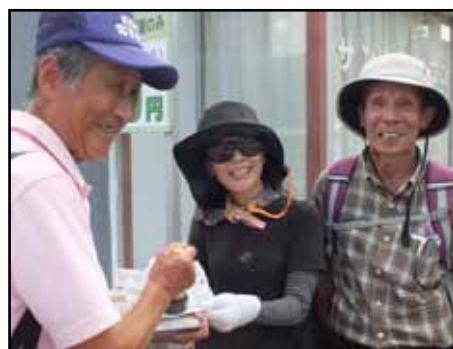
松ヶ崎橋のチェックポイント(16日)