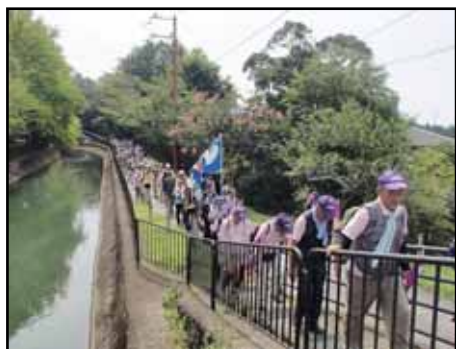
琵琶湖疏水遊歩道(15日)

翌16日は嵐山中ノ島公園で出発式の後、鳥居や左大文字の火床を眺め、船岡山ドリンクサービスで嬉しい一息をつきました。17時、25時それぞれの火床観望コースを巡り、ドリンクサービス、コースガイド、チェックポイントでスタッフの応援に励まされ、猛暑をものともせず歩を進めました。17時ごろに大雨・洪水警報が発表され、急遽ゴール場所を体育館軒下に移動、アンカーゴール後に解散しました。恒例の、公園広場で大文字送り火点火を眺め、行く夏を惜しむ風情を今年には実現出来ませんでした。両日とも、天候が災いし残念な年でした。