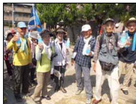
船岡山での給水(16日)