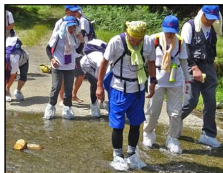
小入谷の増水(初日)