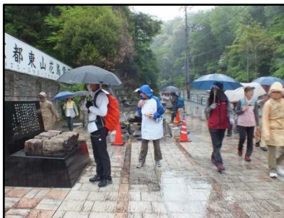
琵琶湖疏水と旧東海道ウォーク 5月6日(土) 曇りのち雨 参加人数: 131名 リカーコレクション 龍野