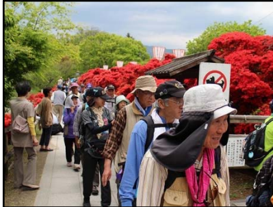
長岡天満宮つつじ観賞ウォーク 4月29日(祝・土) 曇り 参加人数: 248名 ナガオカスポーツ

今年のGWウォークは4基地を訪ね、新緑がまぶしい中を、ウォークしました。各コースでは、出発前のキャンデーサービス、ハツ橋工場での試食、フレッシュ牛乳の試飲なども楽しめました。