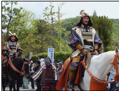
光秀まつりと亀山城下町ウォーク 5月3日(祝・水) 晴れ 参加人数: 161名 山内スポーツ