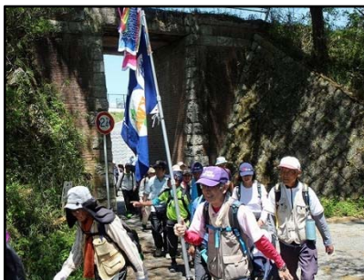
鹿背山の自然と大仏鉄道遺構ウォーク 5月4日(祝・木) 晴れ 参加人数: 253名 カフェ・リュン 加茂駅前店