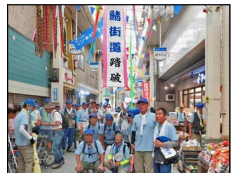
榊形商店街にゴール(二日目)