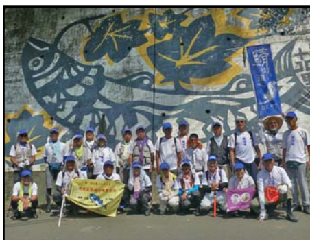
上根来で集合(初日)

◆1月から参加申込の受付をしており、今年も定員に達しました。ありがとうございました。