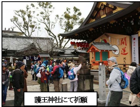
護王神社にて祈願

令和2年の松の内、今年一年の無病息災健康を祈願するため257名のウォーカーが梅小路公園に集いました。即成院では、楽に成仏できるように、今熊野観音寺ではボケ防止を熱心に祈願され、新熊野神社では「さすり木」にご利益を念じた後、高台寺公園で昼食休憩をとりました。昼食後は、がん封じの平等寺等を巡り、ウォークの神様「護王神社」で最後の神頼みをして解散しました。多岐にわたる願を掛け、多くのご利益を期待し、思いを新たにして、皆さん帰路に着きました。