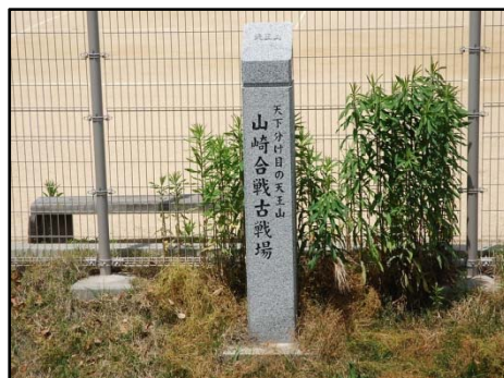
山崎合戦古戦場跡碑