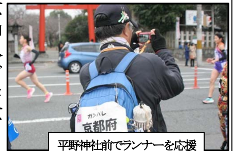
平野神社前でランナーを応援

21 キロ 隊が、先ず宝ヶ池公園を出発、京大・百万遍に至ると、成人式に参加する晴れ着の学生に出会いました。護王神社では、沢山のウォーカーが足の無事を祈っておられました。14 キロ 隊も合流され、紫明通りを西に進み、西大路を南下、平野神社前では、参加者が郷土ランナーの応援を熱心にされていました。下位に甘んじていた京都ランナーが中盤以降で、ごぼう抜きを演じトップに躍り出ました。京都アンカーの「一山さん」がトラックに入場すると、スタンドは割れんばかりのコールで3年ぶりに京都は雪辱しました。