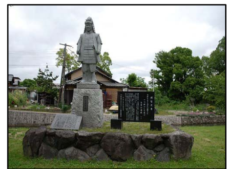
坂本城址公園にある明智光秀像