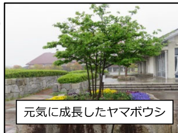
元気に成長したヤマボウシ