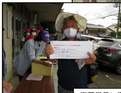
豪華景品に喜ぶ (16日)