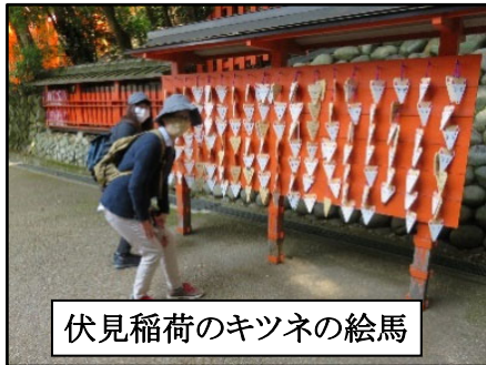
伏見稲荷のキツネの絵馬

剣神社では、絵馬コレクターにも大人気という「とび魚絵馬」が奉納されていました。とび魚が描かれた謂れは諸説があり、トビウオが剣の