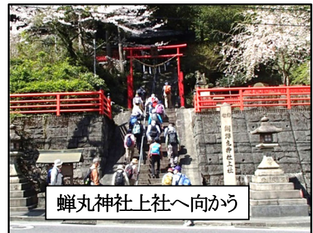
蟬丸神社上社へ向かう