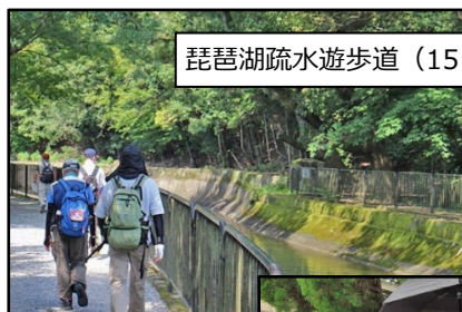
琵琶湖疏水遊歩道 (15日)