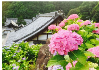
あじさいの名所・柳谷観音