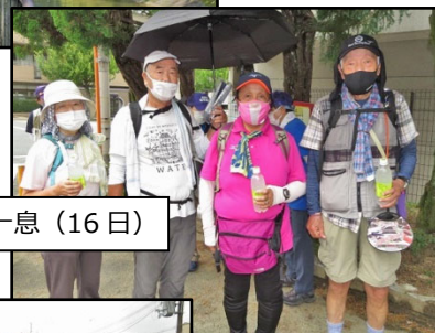
給水を受けて一息 (16日)