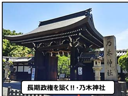
長期政権を築く!!・乃木神社