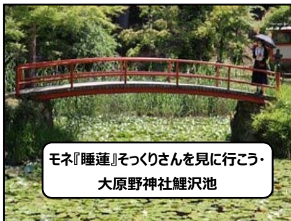
モネ『睡蓮』そっくりさんを見に行こう 大原野神社鯉沢池