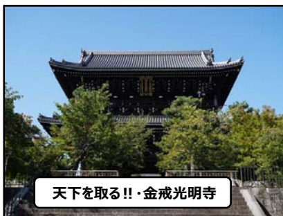
天下を取る!!・金戒光明寺