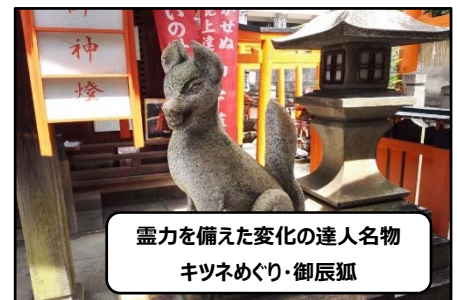
霊力を備えた変化の達人名物 キツネめぐり・御辰狐