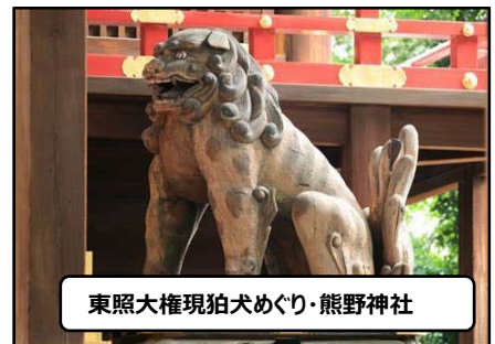
東昭大権現狛犬めぐり・熊野神社