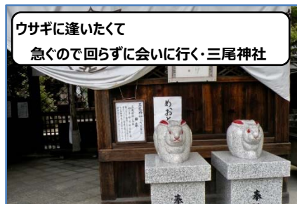
ウサギに逢いたくて 急ぐので回らずに会いに行く・三尾神社