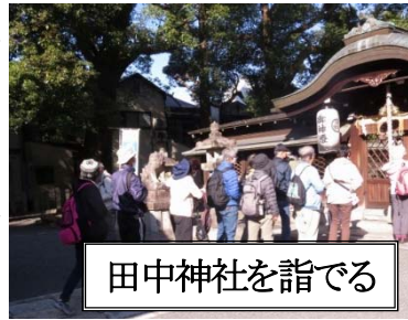
田中神社を詣でる

職者慰霊碑を訪れました。黒谷を更に下り、市南部を一望、途中にアフロヘア風の仏を拝み、平安神宮にゴールしました。