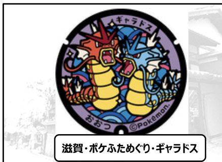
滋賀・ポケふためぐり・ギャラドス