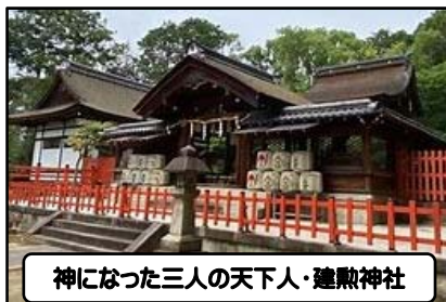
神になった三人の天下人・建勲神社