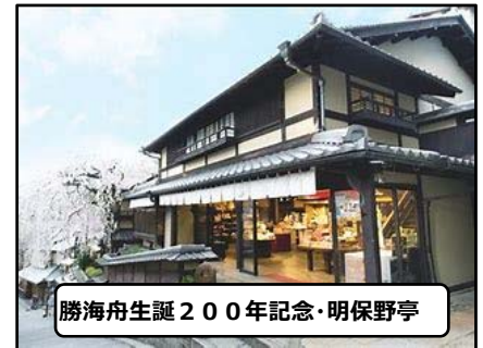
勝海舟生誕200年記念・明保野亭