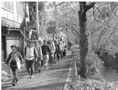
白川疏水道を行く

紅葉の名所、永観堂では燃える様な紅葉をかいま見ました。その後、人ごみを離れて静かな白川疏水道を上りながら、桜葉の紅葉を楽しみ、春の桜満開を想像しつつゴールに到着しました。