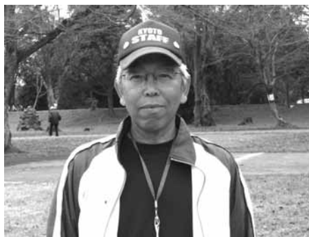
嵐山・中ノ島公園にゴール