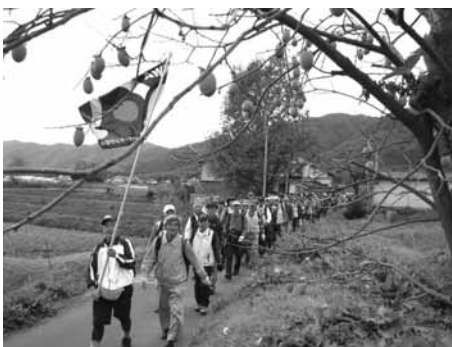
大枝の里山を行く

小高い緑地の桂坂公園で昼食休憩をして、東海自然歩道の竹林を過ぎ松尾大社から、川風が吹く嵐山中ノ島公園に無事ゴールしました。