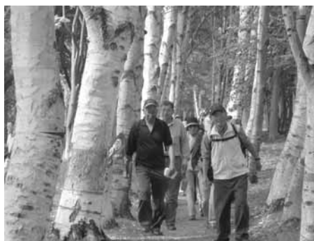
北海道・屯田防風林にて

毎月実施の例会・歩育ウオーク・基地ウオークに加え、隔月には平日ウオークや初級・中級のウォーキング教室が予定されております。今年も会員の皆様楽しんで参加いただけるように努力してまいりますので、ご参加をスタッフ一同お待ちしております。