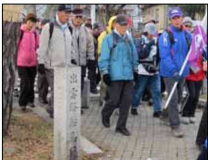
出雲路鞍馬口の碑