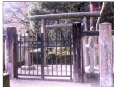
建礼門院が眠る大原西陵