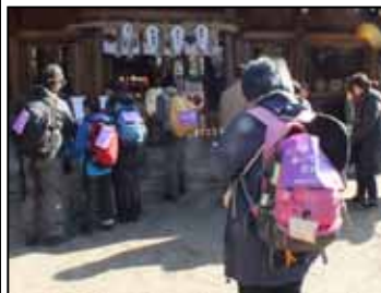
一心に祈る(豊国神社)

梅小路公園をスタートし、三十三間堂、豊国神社を経て参拝客で賑わう東山界限をめぐり初詣しました。震災を振り返り、多くの参加者が一心にお祈りをされておられました。ゴールの三条大橋河川敷会場では、お神酒と、ウォーキングシューズ等が当たる大抽選会を楽しんでいただきました。