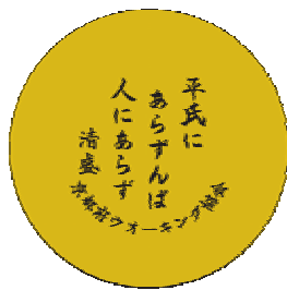
源平ゆかりの特製バッジ (3種類)