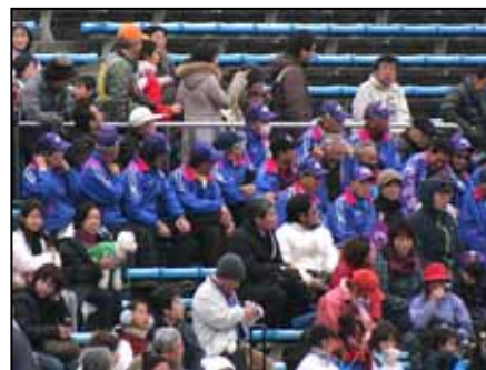
スタンドで選手に声援

スタンドには協会スタッフが集合、ゴールするアンカーらに声を限りのエールを送っていました。