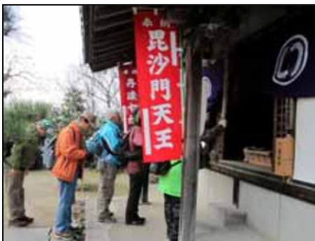
毘沙門天を詣でる