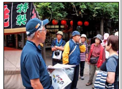
小江戸めぐりの一行(2005年)