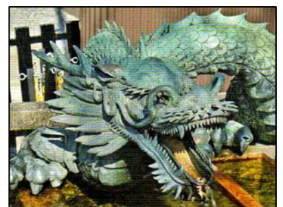
清水寺の龍(パンフから転載)