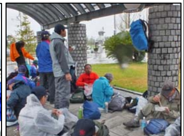
雨宿りの昼食風景