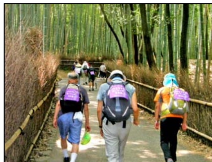
嵯峨野竹林を行く