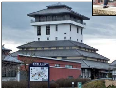
博物館として公開中の観峯館