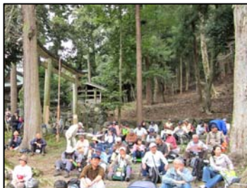
静原児童公園で昼食