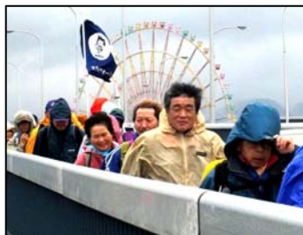
強風の琵琶湖大橋を行く

全行程荒天でしたが皆さん元気に事故もなく完歩され、思い出に残る例会でした。ご苦労様でした。