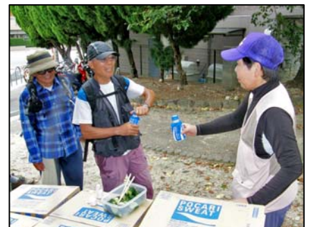
船岡山でのドリンクサービス