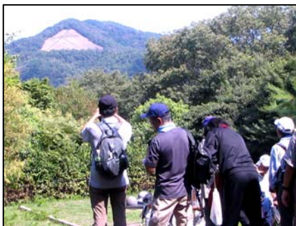
大文字火床を観望