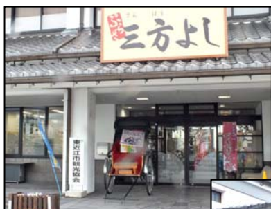
観光協会に架かる「三方よし(売り手よし、買い手よし、世間よし)」の看板