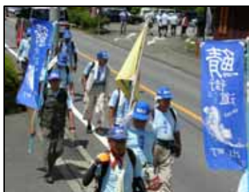
16日のウォーク(大原)