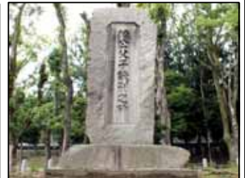
楠木父子別れの碑