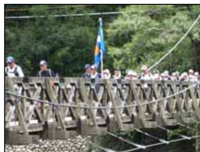
天ヶ瀬吊橋を行く