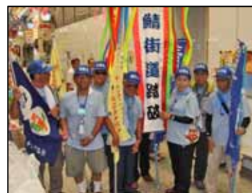
榊形商店街でのゴール