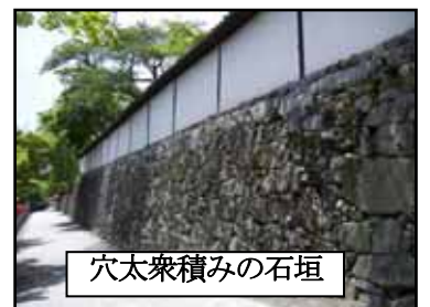
穴太衆積みの石垣