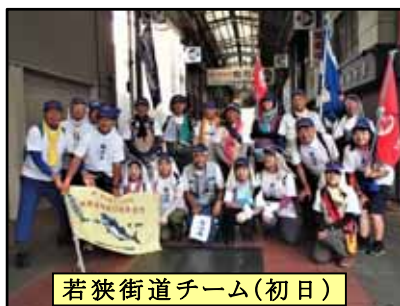
若狭街道チーム(初日)