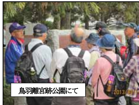
鳥羽離宮跡公園にて

京都五山送り火W(8/16)は、当日朝7時に気象警報が発表されていると、中止となります。 KWA協会事務所(075-353-6464 自動アナウンス)あるいはホームページで確認ください。