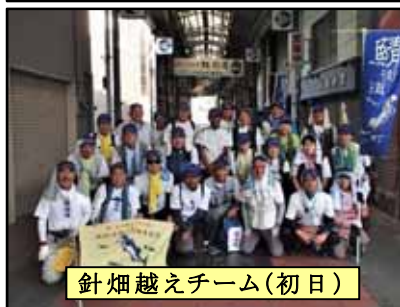
針畑越えチーム(初日)