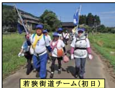
若狭街道チーム(初日)