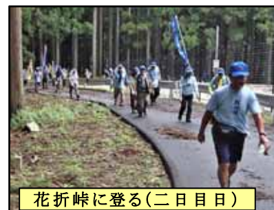
花折峠に登る(二日目)