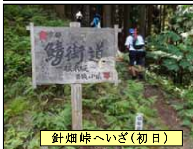
針畑峠へいざ(初日)