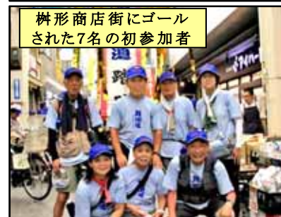
榊形商店街にゴールされた7名の初参加者