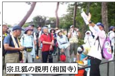
宗旦狐の説明(相国寺)

出発後、二条公園では、語部から「鶴(ぬえ)退治」、そして「百鬼夜行」の逸話を聞きました。北野天満宮で休憩後、上七軒を経て橋公園で昼食休憩となりました。英気を十分に養い、午後のトップには、参拝客で賑わう清明神社を詣でました。その後、一条戻り橋を経て、御所の鬼門封じ・猿ヶ辻を訪ねました。相国寺に入り、宗旦狐のいわれを語部が述べる頃には雷鳴がとどろき、大粒の雨が降り出しました。先頭がゴールに到着するや否や、土砂降りの雨が襲ってき、20分ほどの雨宿りで収まり解散しました。題名通り鬼に襲われたような例会でした。