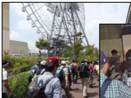
エキスポCITYの大観覧車

蒸し暑い日になりました。JR茨木駅を出発して、エキスポロードを西に進み、万博公園東口駅前広場で休憩後、太陽の塔やエキスポCITYの大観覧車を望みながら、紫金山公園で昼食休憩を取りました。昼食後、工場見学者は3班に分けて向かい、到着後見学コースを巡り、最後に出来立ての美味しいビールを試飲しました。