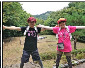
展望台で大の字ポーズ