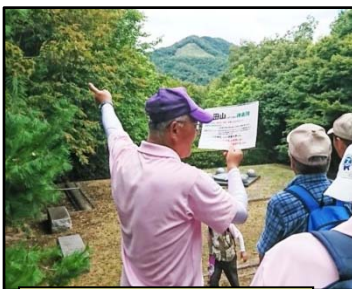
展望台から火床を望む