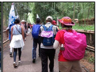
竹林の小径を行く