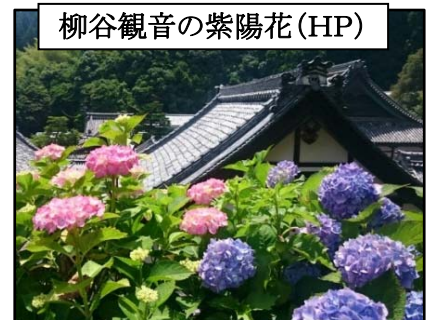
柳谷観音の紫陽花(HP)