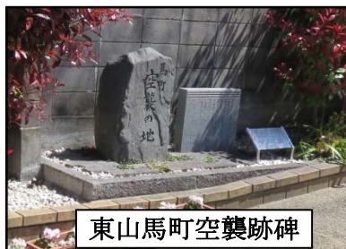
東山馬町空襲跡碑