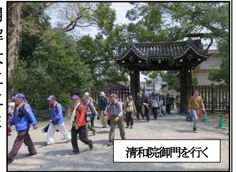
清和院御門に行く

御所の一般公開を楽しむ為に解散。昼食後、丸太町通りを経て、二条公園からJR二条駅にゴールしました。