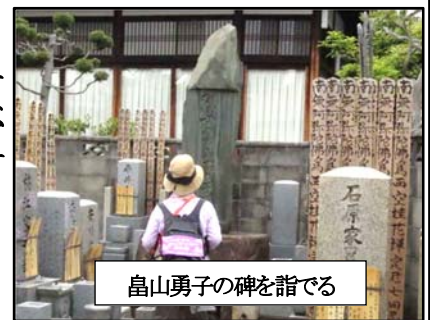
畠山勇子の碑を詣でる

七条通りまで南下、龍谷大学の凜とした建物を見学し、伝道院を訪れ、塩小路公園にゴール。時代を遡り学ぶことが多かったウオークでした。