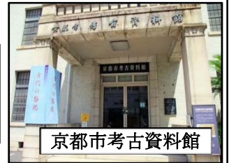
京都市考古資料館