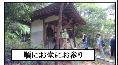
順にお堂にお参り

28名の小グループで、仁和寺の裏山・成就山に整備された八十八ヶ所の霊場めぐりにチャレンジしました。距離は手ごろでしたが、急なアップダウンや岩山ありと変化に富み、ハードなコースでした。多くのご利益を頂き、充実したウォークでした。