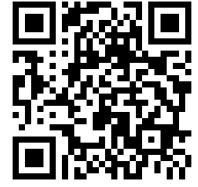
ホームページのお問合せ